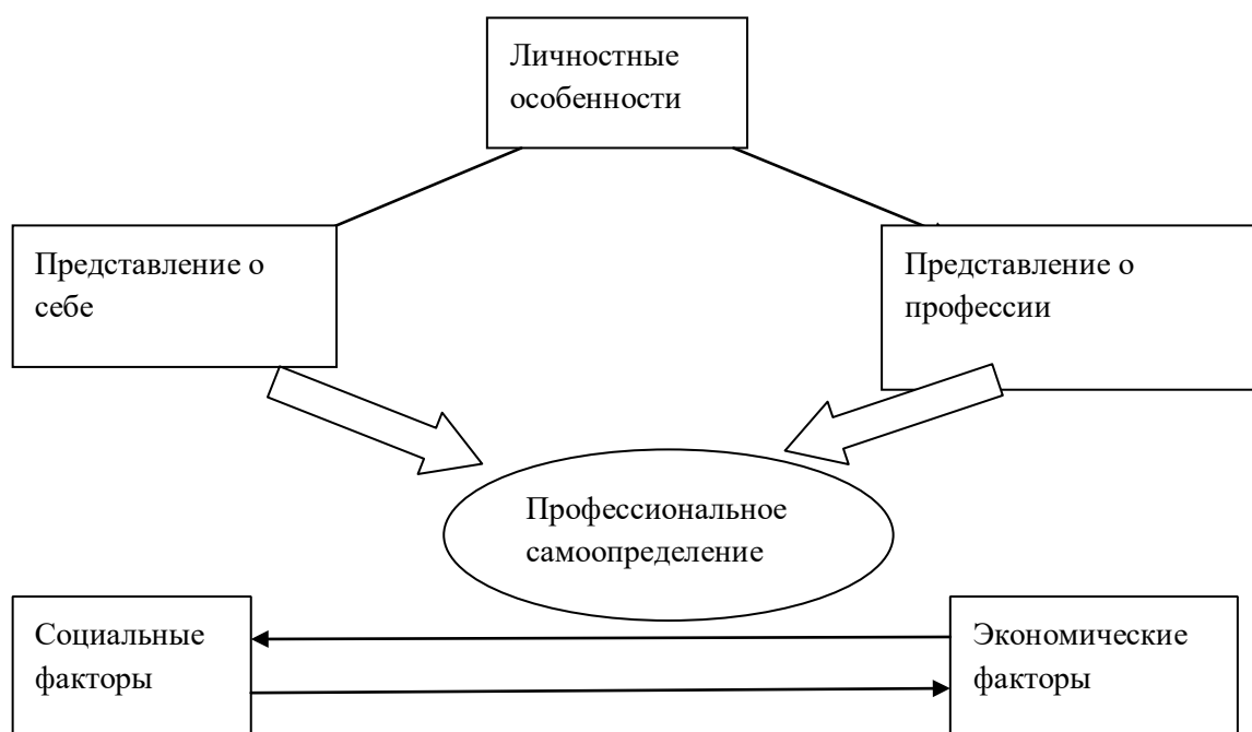
Рис. 1 Профессиональное самоопределение

Поставленные задачи могут иметь только комплексное решение. Вся деятельность по формированию профессионального самоопределения у обучающихся в общеобразовательных учреждениях, с одной стороны, должна иметь системный характер, но с другой – необязательно быть представленной единой программой. Это означает, что различные направления учебной и воспитательной работы могут быть сконцентрированы на решении задач профессионального самоопределения, что, в конечном итоге, позволит выпускникам адаптироваться в современном мире и быть успешными в обществе.